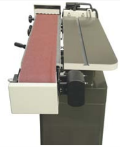
● Lijado horizontal