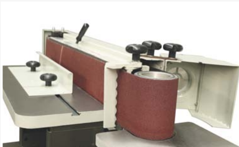
● Lijado libre en final rodillo con mesa ajustable.