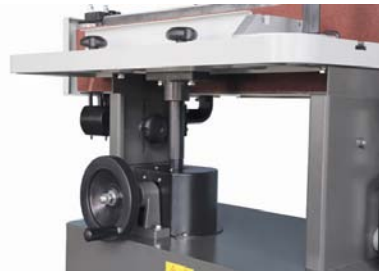
Sistema de volante para la mesa elevable.