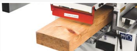
● Regruesadora con capacidad hasta 90 mm (altura)