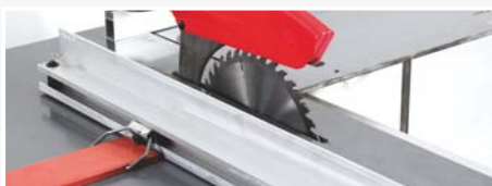
● Altura de corte hasta 80 mm