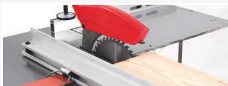
● Protector de la mesa. En función sierra circular permite el escuadrado de tableros de 1200 x 600 mm