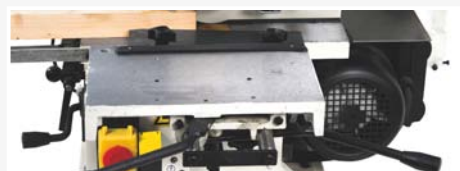
● Taladro mortajador acepta brocas desde 6 hasta 12 mm (con casquillos / suministrados de serie)