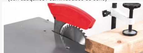
● Permite el corte por testa