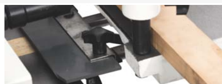
● Tupi horizontal. Permite realizar galces y rebajes