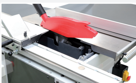
● Altura corte 90 mm