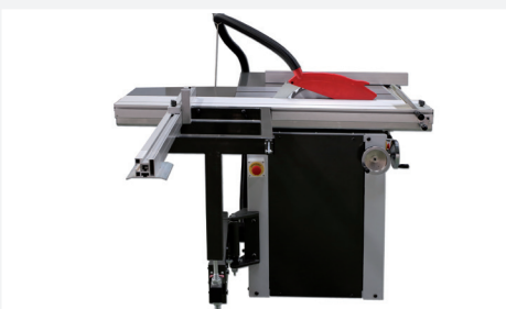
● 1.220 mm de corte por guía carro