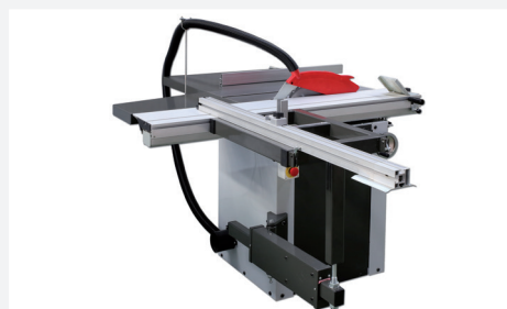
● Brazo telescópico