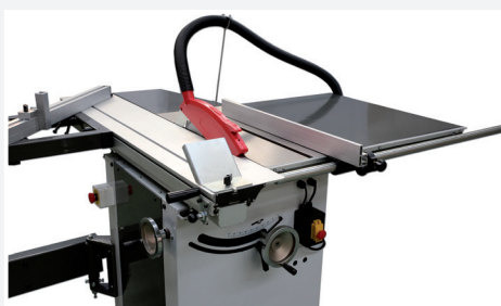
● Regulación inclinación y subida bajada por volantes