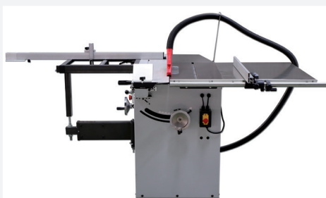
● 940 mm de corte por guía