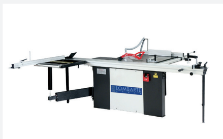
● Detalle sierra circular PS 2600