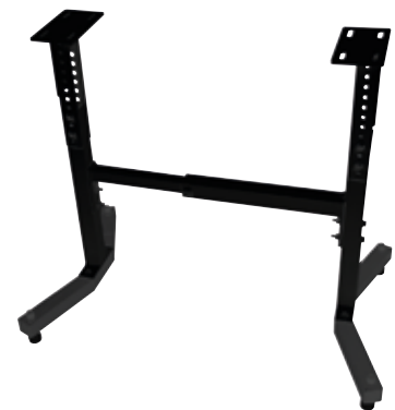
BASE PARA TORNO MC 1420 VF