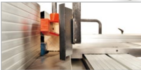
● Flejes prensores