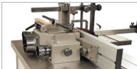
● Guía en aluminio con toma aspiración