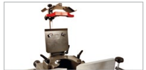
● Protecciones abatibles