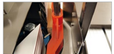
● Fleje guía madera