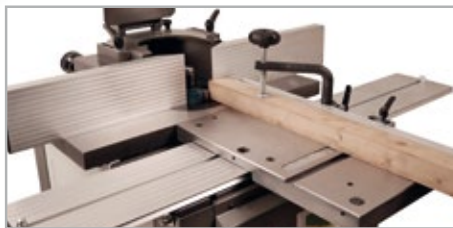
● Carro espigar