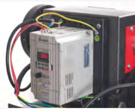
● Inverter Delta, una primera marca