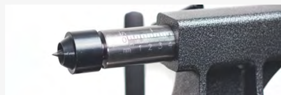
● Contrapunto milimetrado