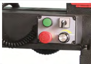
● Mando magnético con cable