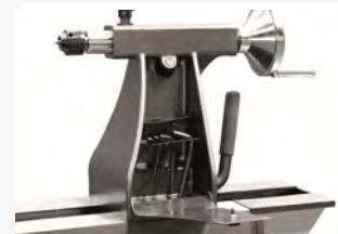
● Armario herramientas