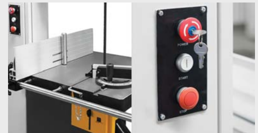
Guía ingleses y guía de aluminio. Llave de seguridad