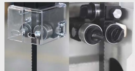
Guía cinta profesional, guía inferior con ajuste rápido