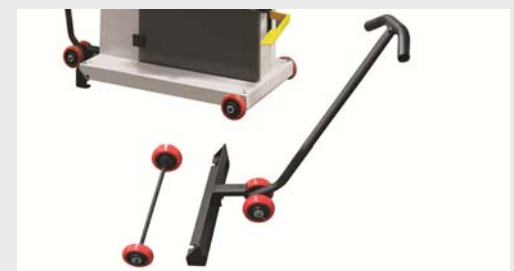
Kit mobility OPCIONAL